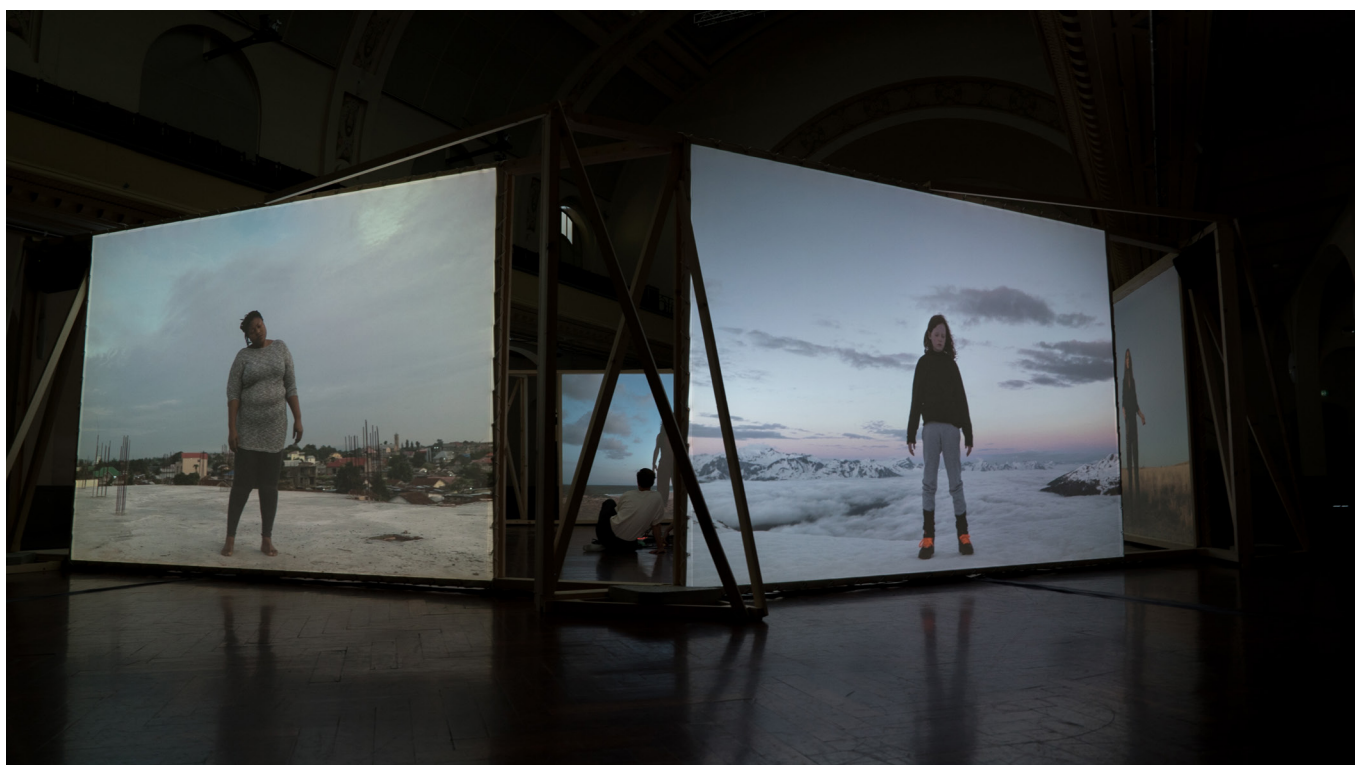
ORLANDO La Bâtie