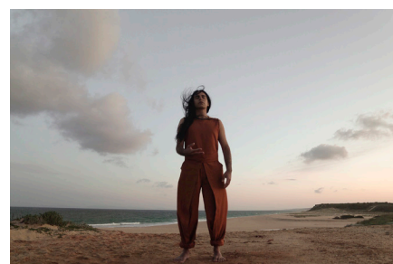
ORLANDO © Horace Lundd 2018, VARANASI, BERLIN, LISBOA BELO-HORIZONTE

Contact: presse@accelerateurdeparticules.net +00 33 (0)6 66 02 10 16